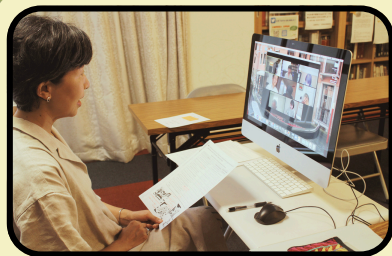
オンラインレッスン